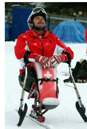
O sole mio...